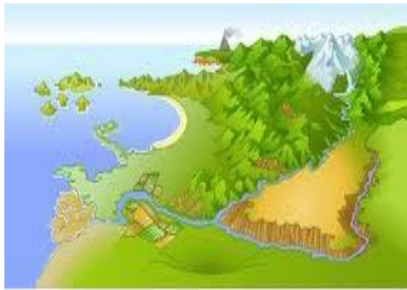
El relieve terrestre

Es posible que la ilustración de la izquierda pertenezca a un libro de