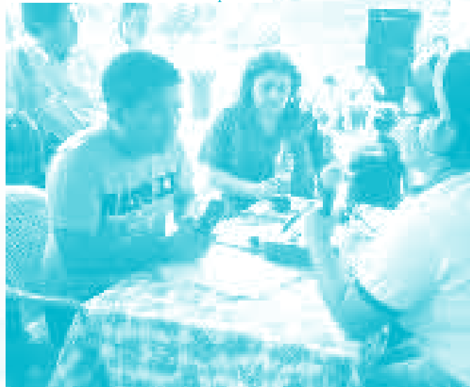
La radio cultural se hace con el pueblo.

Hace unos años escuchamos esta afirmación que decía: la iglesia no debe esperar más que los cristianos llenen los templos; sino que debe salir al encuentro de ellas y ellos. Esto mismo se puede aplicar en la radio: no podemos quedarnos en la radio de cabina, en el acomodamiento, sino más bien salir a atender los problemas de la comunidad, de la gente que también son buena noticia.