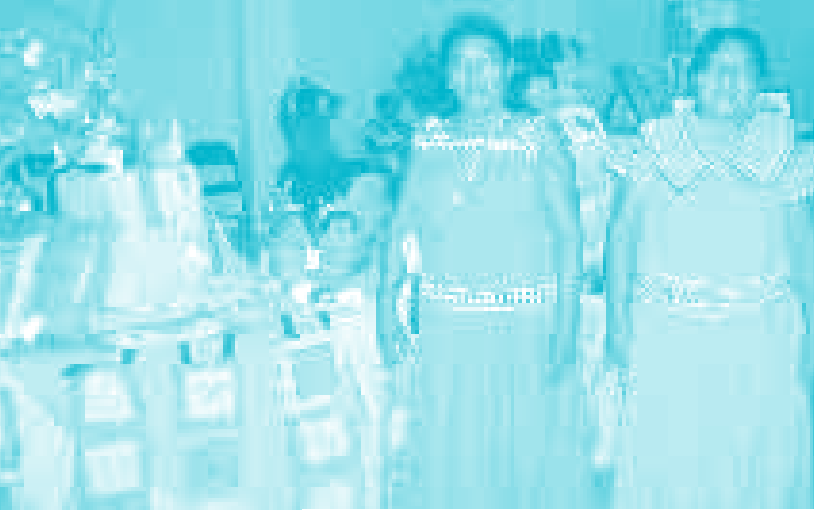
Exposición de artesanías, mujeres Ngobe de la comunidad de San Antonio, zona sur de Costa Rica.