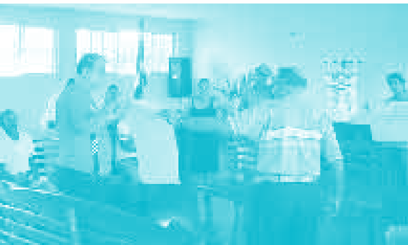
Capacitarse para ser mejor.

Para palpar la trascendencia que han tenido estas emisoras, basta con hablar con diferentes personas de la comunidad, quienes comentan que en el proceso, han tenido épocas de muchos frutos y otras de desierto. Desde mi análisis, creo que el proyecto ha generado resultados satisfactorios; no obstante, requiere de una mayor fiscalización y control de todo el trabajo que se está realizando en cada una de ellas.