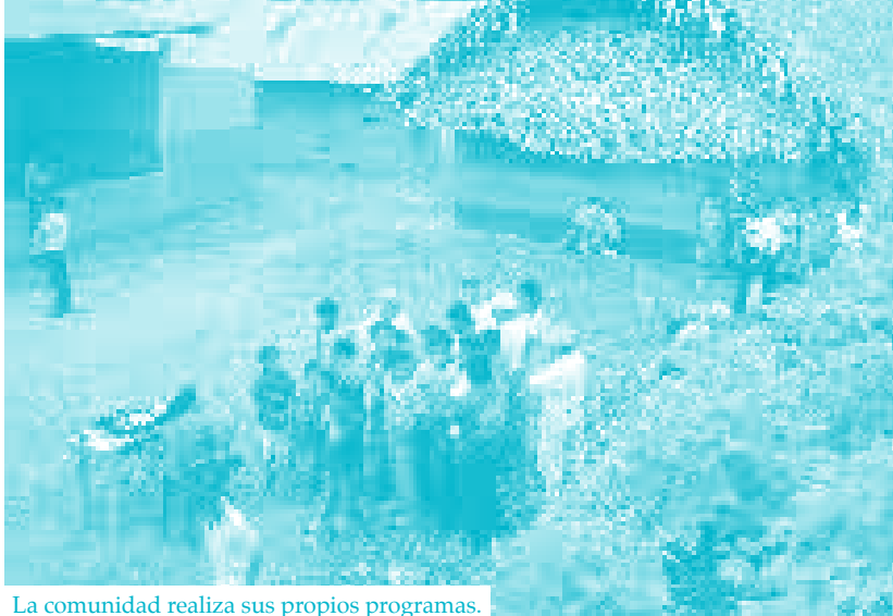
La comunidad realiza sus propios programas.

En este sentido, la radio no es solo el transistor o caja de música que suena, sino la herramienta que lleva a la ciudadanía distintos programas que le ayudan a su participación; por ello, hemos trabajado en distintas modalidades