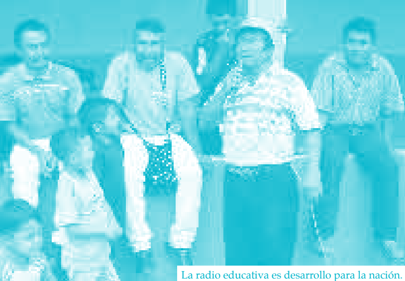
La radio educativa es desarrollo para la nación.

En este camino es que hemos ido haciendo radio para miles de personas, entendiendo que la labor educativa es sólo un paso para el desarrollo del país.