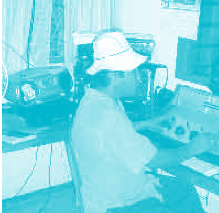
La Voz de Talamanca es la voz de los indígenas.