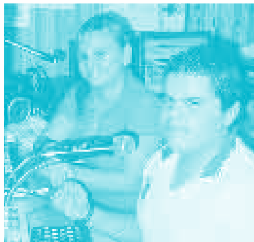
La radio cultural es para formar, informar y entretener.