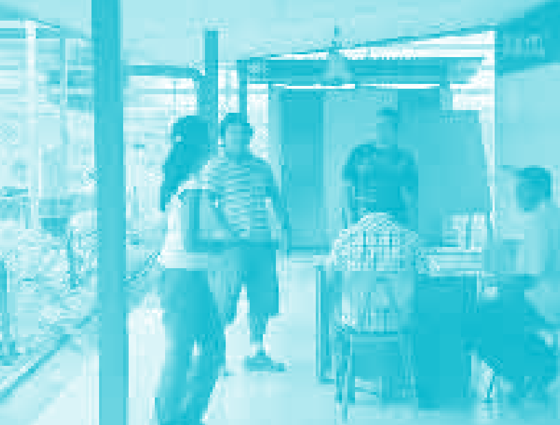
Voces jóvenes de la emisora cultural.

des, parte de un visionario proyecto que continúa dando voz a las zonas rurales de nuestro país.