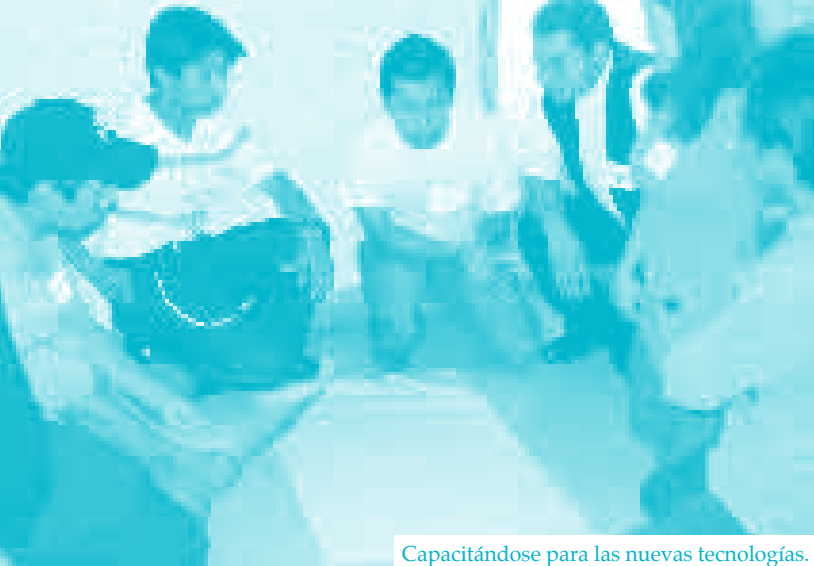
Capacitándose para las nuevas tecnologías.

ción más contundente del interés social de las personas que se hacían cargo de las mencionadas emisoras. Coincide esta situación con el fin de las dictaduras militares, lo que permite que estas personas se sientan con mayor libertad para expresar su opinión e involucrarse en los cambios.