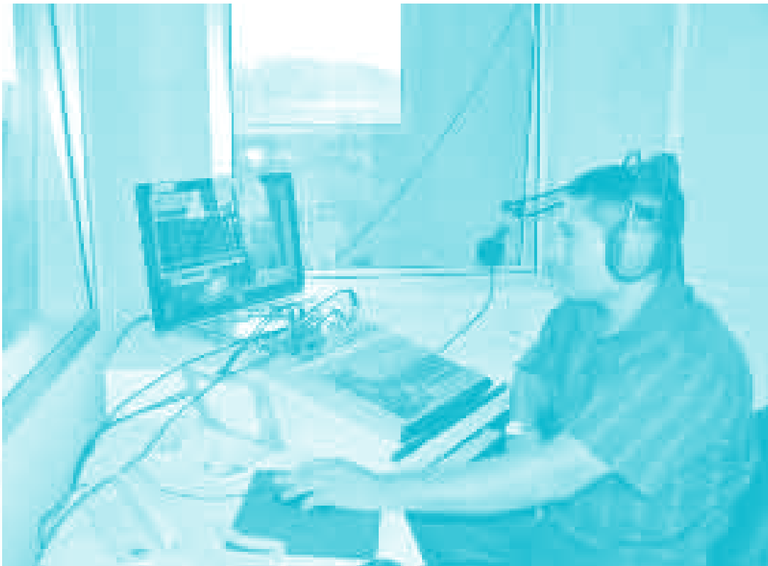
El IHER es una respuesta educativa para el pueblo hondureño.