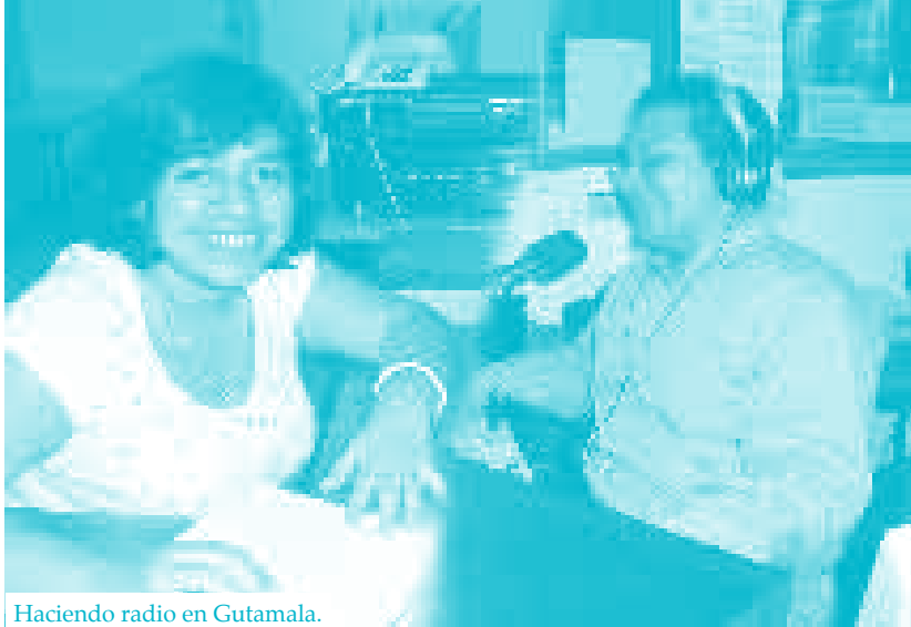
Haciendo radio en Gutamala.

Austroconsult proyectaba que los alumnos potenciales del Instituto aumentarían de 1.7 millones en 1981 a 2.9 millones en 2000. En función de estos datos, se esperaba la inscripción de unos 300,000 alumnos en los años que le quedaban a la década de los ochenta y de unos 700,000 en los años 90.