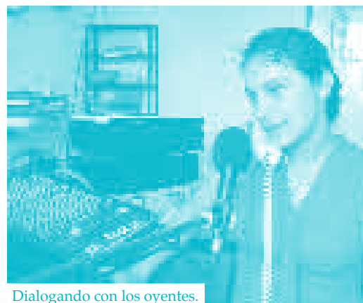
Dialogando con los oyentes.

Evidentemente, las decisiones serían el primer paso para iniciar el camino que llevaría a