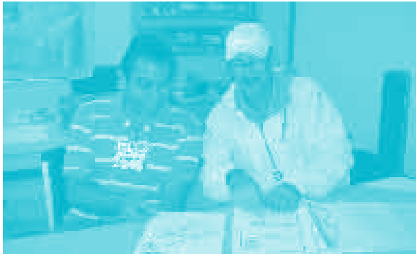
La emisora cultural es una empresa al servicio de la comunidad.