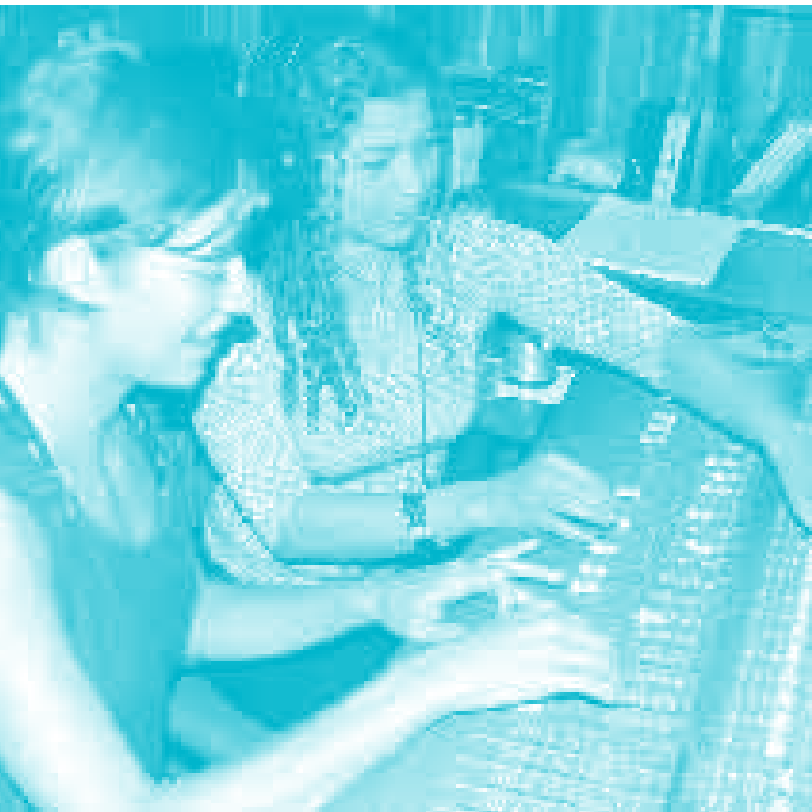
“Heredamos el mejor instrumento de comunicación”.