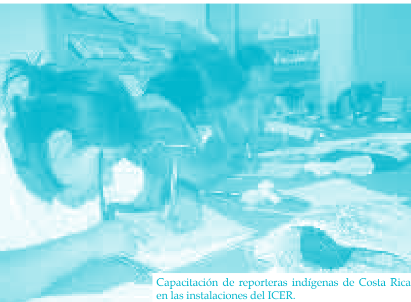
Capacitación de reporteras indígenas de Costa Rica en las instalaciones del ICER.

la diversidad cultural aborígen. También en el desenvolvimiento de la libertad de expresión de los pueblos indígenas costarricenses.