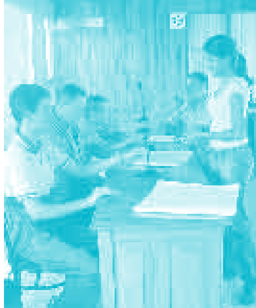
Haciendo radio en Pérez Zeledón.

Por otro lado, cada vez tienen más el deber de auto-gestionar su financiamiento y proyectarse a todos los sectores de la comunidad, sin perder la raíz cultural que las caracteriza. Es posible que aun puedan explotar más los recursos que tienen disponibles, dar voz a actores sociales, jóvenes y mayores en encuentros inter-generacio-